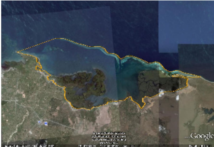
Study site outline