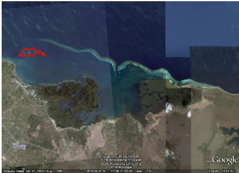
Coral reef 3