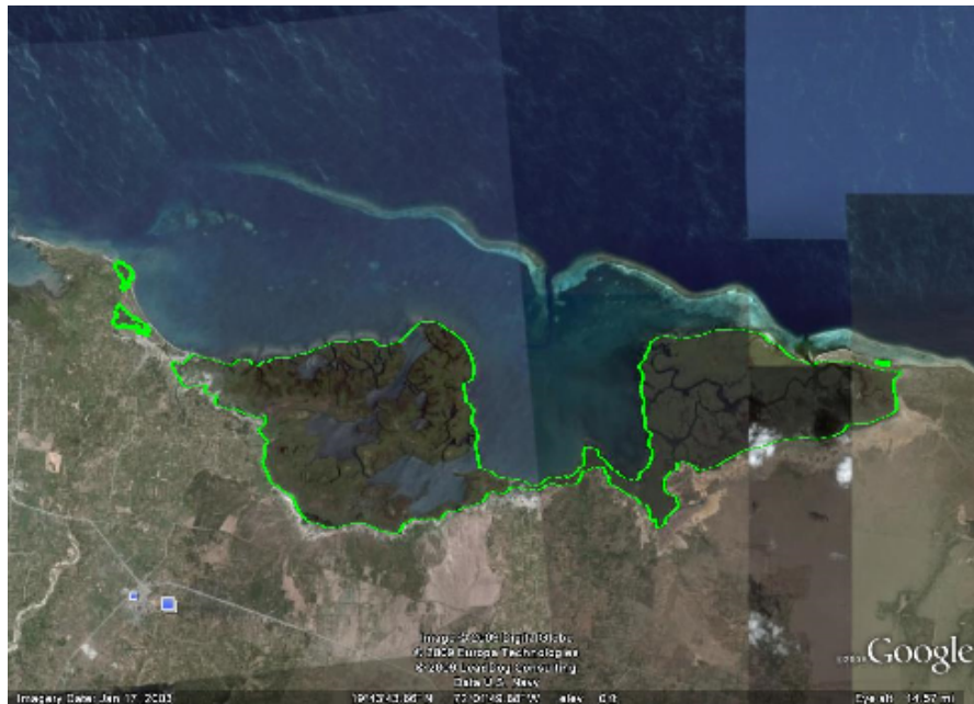
Mangroves 1, 2, 3, and 4