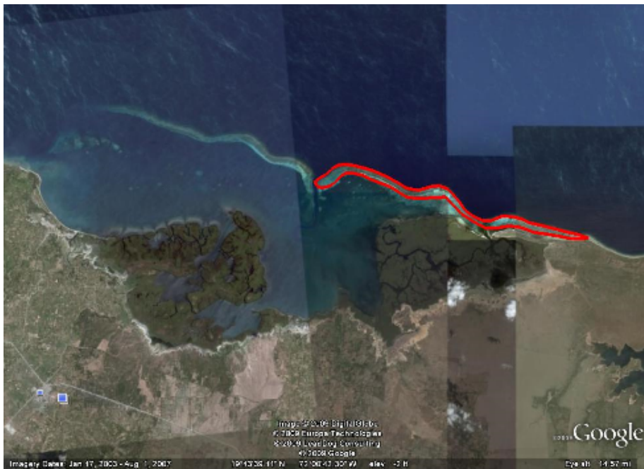
Coral reef 1