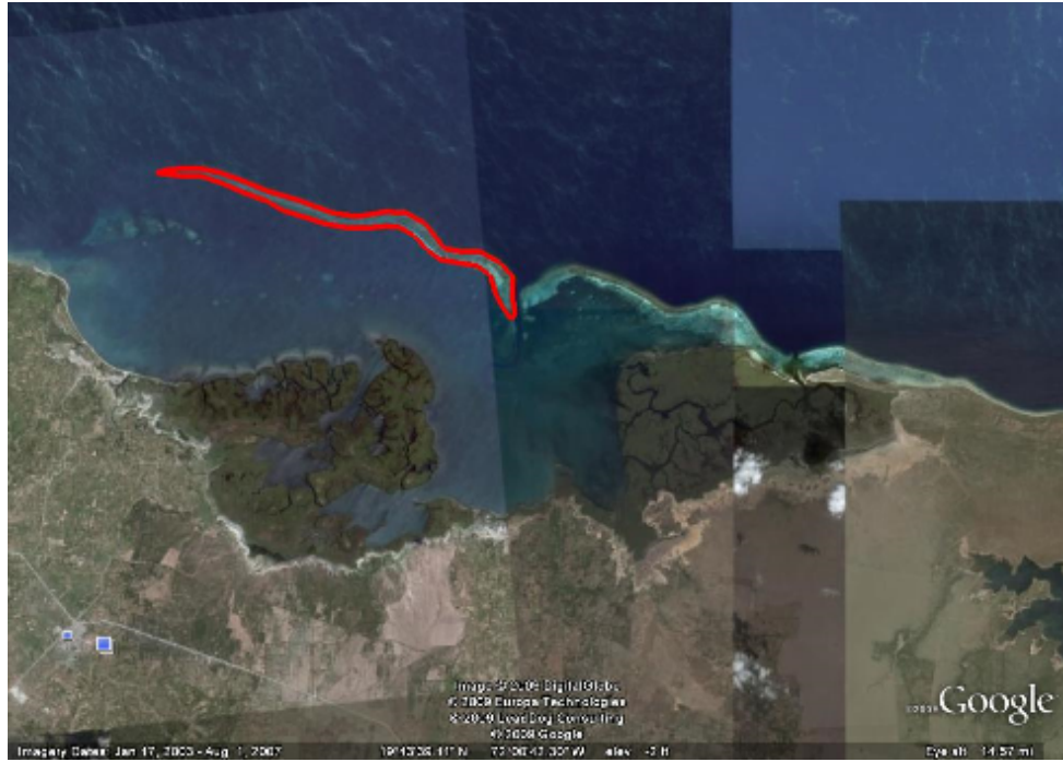
Coral reef 2