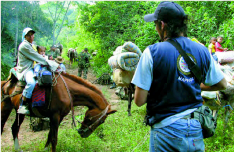
Integrantes del Bloque Pacífico de las AUC concentrados en la zona de ubicación en espera del acto de desmovilización. Istmina, Chocó. Agosto de 2005