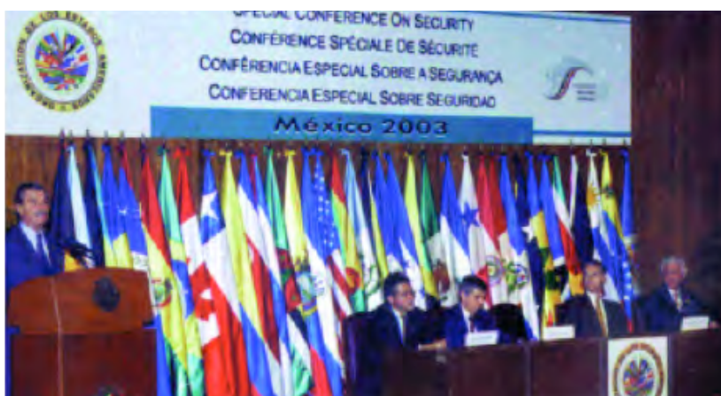
Conferencia Especial sobre Seguridad. México D.F., México, 27 y 28 de octubre de 2003

Durante la Conferencia Especial sobre Seguridad de la OEA celebrada en México en octubre de 2003, los líderes de la región establecieron un nuevo concepto sobre seguridad hemisférica que recoge las preocupaciones principales de cada uno de los Estados.