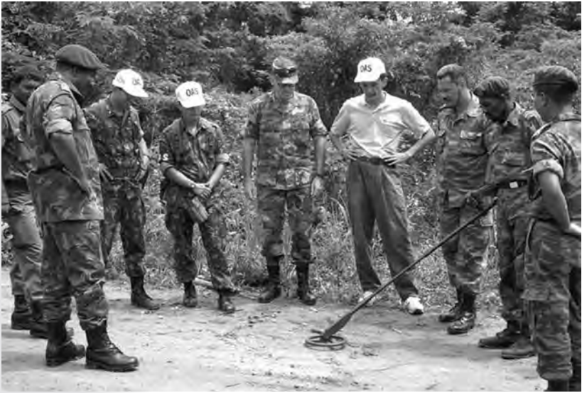
La OEA coordinó las operaciones de desminado en Suriname