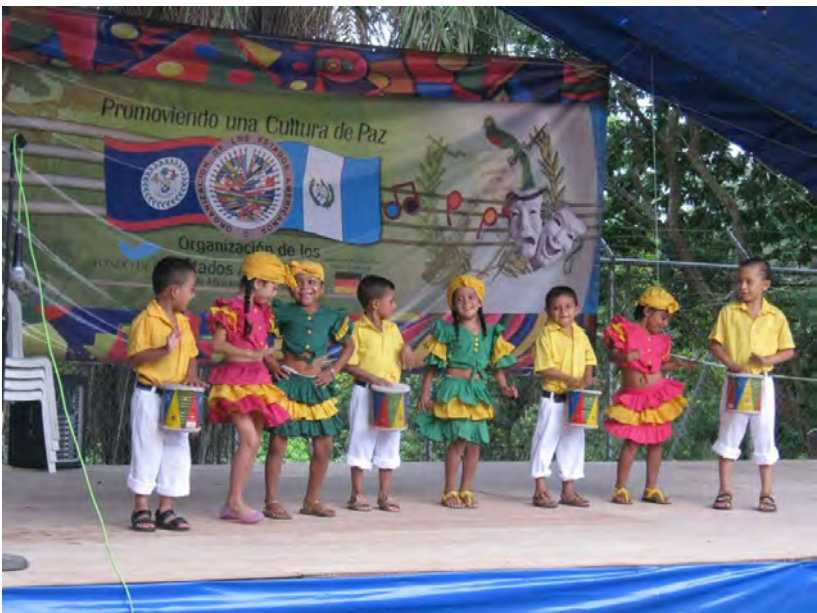
Programa de Promoción de una Cultura de Paz para las comunidades residentes en la Zona de Adyacencia