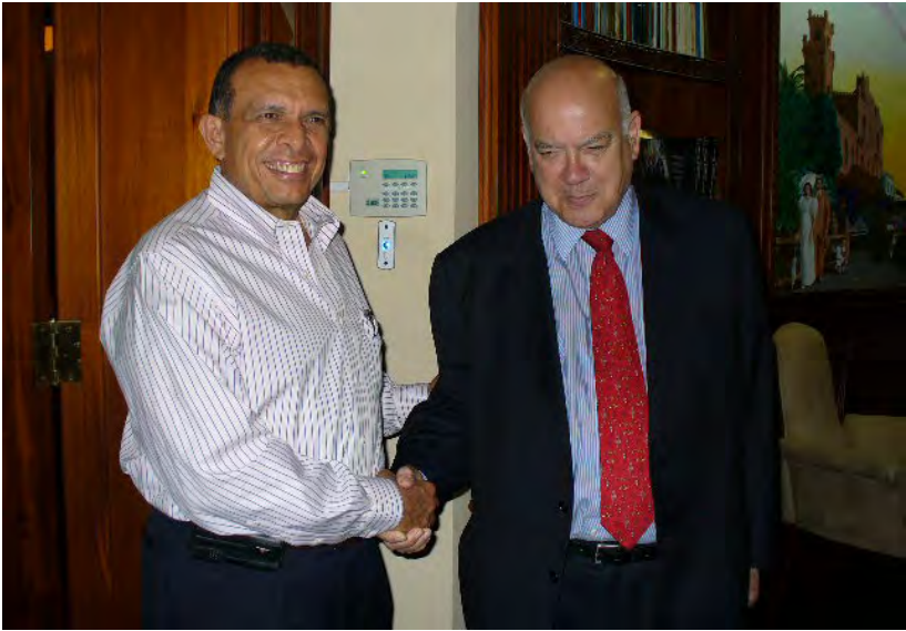
El Secretario General de la OEA, José Miguel Insulza, se reúne con el Presidente de Honduras, Porfirio Lobo, para discutir la reincorporación de Honduras a la Organización. Tegucigalpa, Honduras, mayo de 2011