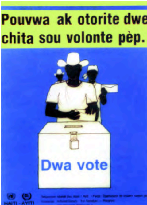
“Las personas participarán libremente en el proceso democrático sólo cuando tengan la seguridad de que su voto cuenta y será contado”. Un afiche escrito en creole promueve la votación en Haití