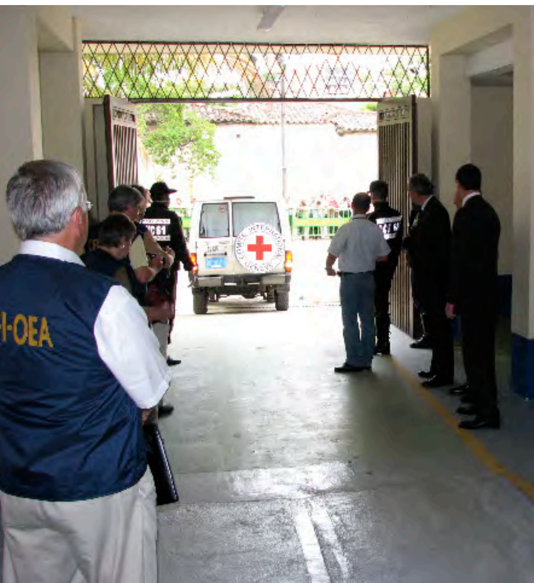
Miembros de la Comisión Forense Internacional observan el traslado de las víctimas