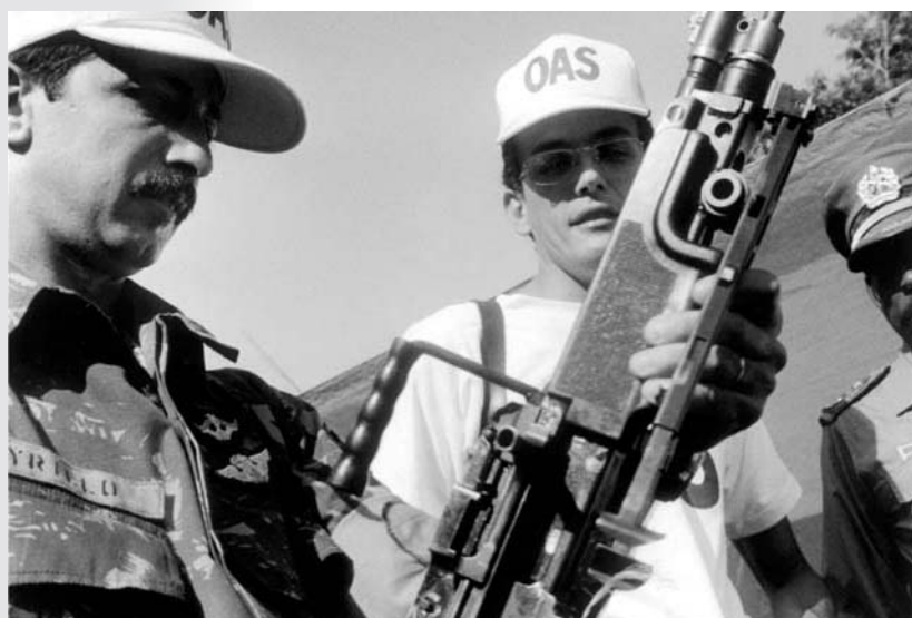
Casi 4.000 piezas de equipo militar, incluyendo rifles y explosivos, fueron entregados a funcionarios de la OEA en Suriname