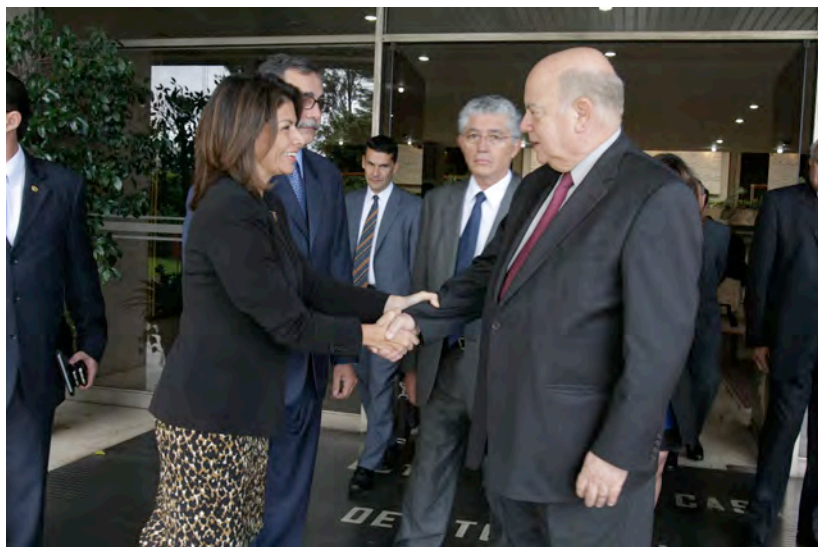
La Presidente de Costa Rica, Laura Chinchilla, recibe al Secretario General de la OEA en San José, Costa Rica. 6 de noviembre de 2010

El 8 de marzo de 2011 la Corte Internacional de Justicia, a la que había acudido el Gobierno de Costa Rica para dirimir el diferendo con Nicaragua, emitió una resolución sobre medidas provisionales de cumplimiento obligatorio a adoptar por los dos países. Entre dichas medidas, la Corte dictó que ambas partes se abstengan de enviar o mantener personal militar o de seguridad a la zona en cuestión, coincidiendo así con las recomendaciones del Consejo Permanente de la OEA.