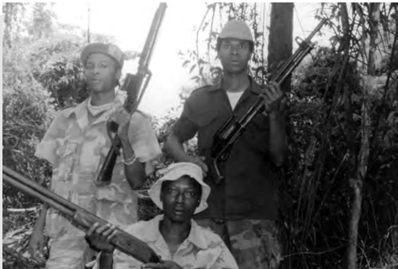
Después de participar en el desarme de la resistencia en Suriname, la OEA coordinó un programa de diez años de reconciliación e integración social