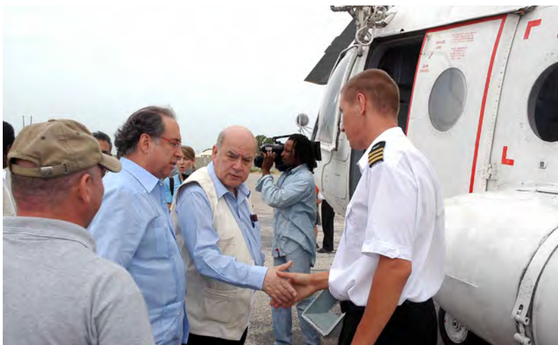
El Embajador Juan Gabriel Valdés, entonces Representante Especial del Secretario General de la OEA y del Secretario General de las Naciones Unidas para Haití y Jefe de la MINUSTAH, con el Secretario General de la OEA, José Miguel Insulza, durante la visita de la Misión de Observación Electoral de la OEA a Haití. Febrero de 2006