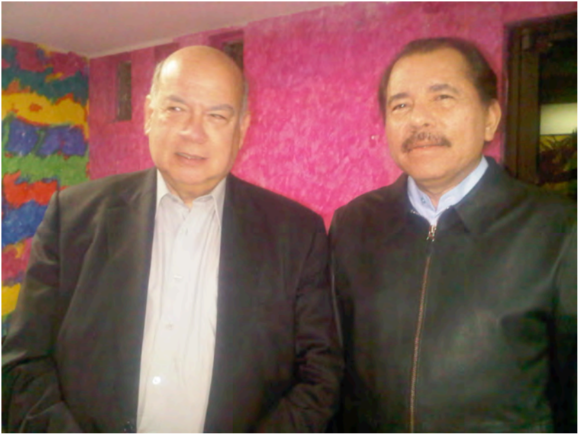
El Secretario General de la OEA se reúne con el Presidente de Nicaragua, Daniel Ortega, en Managua, Nicaragua. 6 de noviembre de 2010