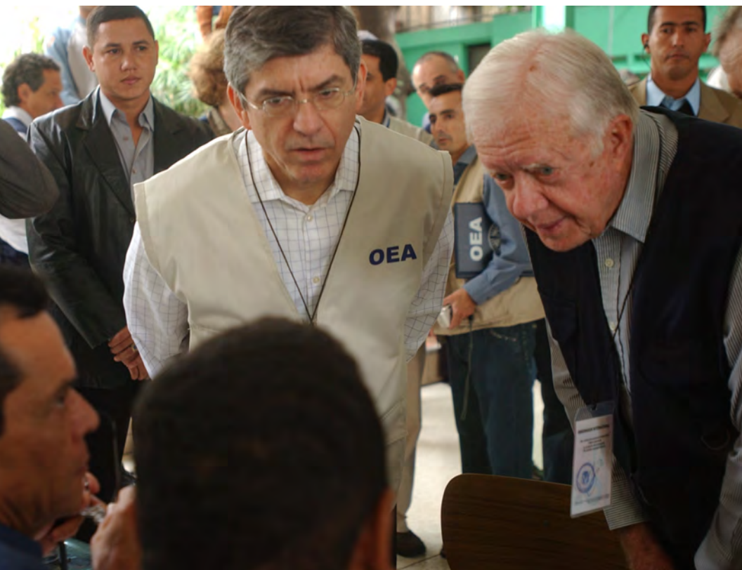
El entonces Secretario General de la OEA, César Gaviria, y el ex Presidente de Estados Unidos y fundador del Centro Carter, Jimmy Carter, durante el Referéndum Revocatorio Presidencial

que lo Apoyan y la Coordinadora Democrática y las Organizaciones Políticas y de la Sociedad Civil que la Conforman”, para encontrar una solución a la crisis del país por la vía electoral. El 15 de agosto de 2004 la OEA envió una Misión de Observación Electoral a fin de observar el Referéndum Revocatorio Presidencial, el cual tuvo lugar de forma pacífica y ordenada.