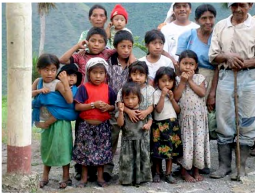
Miembros de una de las comunidades afectadas por la construcción de la Hidroeléctrica Chixoy

El proceso de negociación fue complejo, con varias dificultades y retrasos, y el Acuerdo Político sucesivamente enmendado y renovado. Sin embargo, gracias a la buena fe de las Partes, y en particular la perseverancia de las comunidades representadas por la COCAHICH y la voluntad política del Gobierno de Guatemala de continuar el diálogo y garantizar la reparación debida, el 20 de abril de 2010, ambas delegaciones concluyeron por consenso la elaboración del Plan de Reparación. Adicionalmente, acordaron que el referido Plan se institucionalizaría por medio de un Acuerdo Gubernativo cuya versión borrador también consensuaron. El trámite gubernamental interno comenzó en mayo de 2010, sin haberse concluido hasta la fecha, encontrándose pendiente el cumplimiento de los acuerdos alcanzados y de los compromisos asumidos.