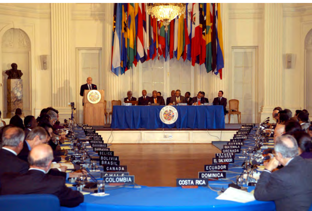
Sesión Protocolar del Consejo Permanente de la OEA para recibir al Primer Ministro Interino de Haití, Gérard Latortue. Washington D.C., Estados Unidos, 2 de diciembre de 2005