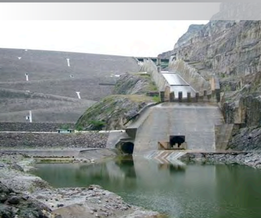
Hidroeléctrica Chixoy en Guatemala