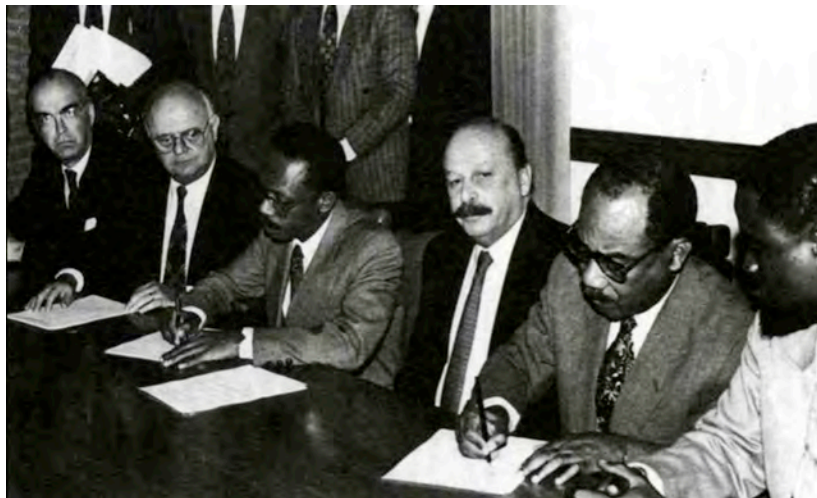
El entonces Presidente de Haití, Jean Bertrand Aristide, firma el Protocolo de Washington en la sede de la OEA. Febrero de 1992

Como parte del proceso de consolidación y fortalecimiento de la democracia, en 1992 la Asamblea General suscribió en la ciudad de Washington el Protocolo de Reformas a la Carta de la OEA conocido como el Protocolo de Washington, en donde queda establecido que cualquier miembro de la Organización cuyo gobierno democráticamente constituido sea derrocado por la fuerza podrá ser suspendido del ejercicio del derecho de participación en las sesiones de la Asamblea General. Este principio demuestra la importancia que la democracia tiene dentro de la institución y su normatividad.