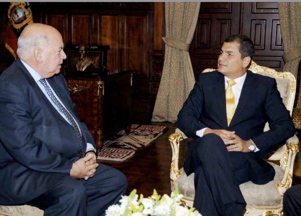
El Secretario General de la OEA se reúne con el Presidente de la República del Ecuador, Rafael Correa. Quito, Ecuador. Octubre de 2010