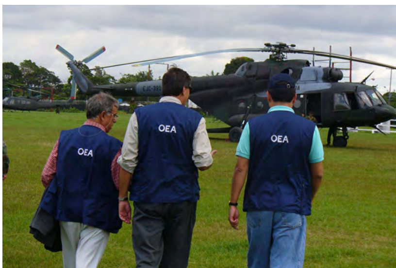
Miembros de la Misión de Buenos Oficios de la OEA en Colombia y Ecuador