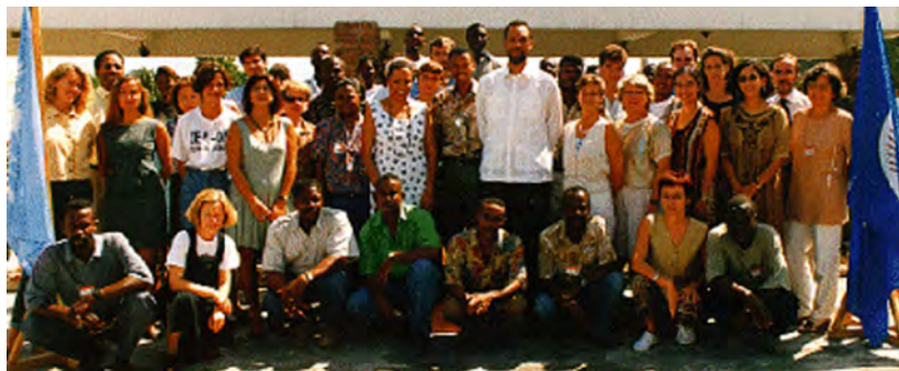
Miembros de la Misión Civil Internacional de la OEA/ONU en Haití (MICIVIH)