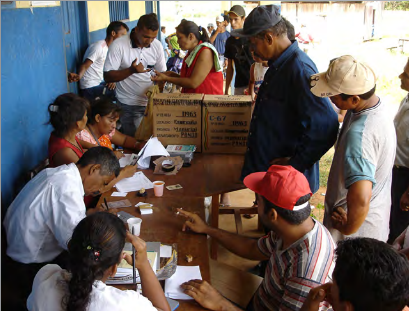
Misión de Observación Electoral de la OEA en Bolivia, diciembre de 2005