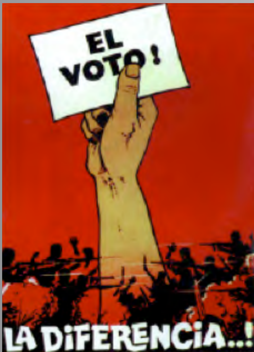
Este afiche de El Salvador refleja el sentimiento popular de que el voto es el antídoto para la guerra