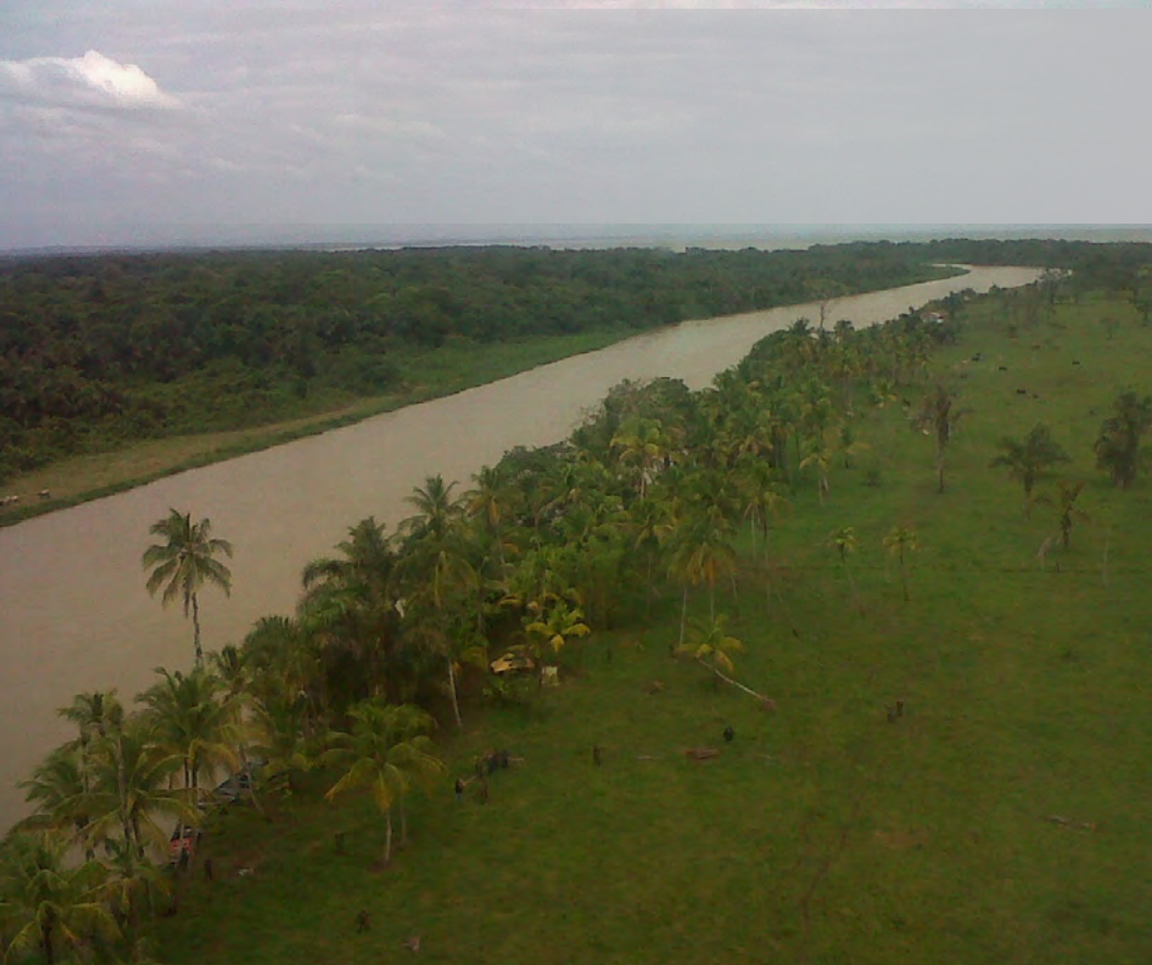
Vista aérea de la zona limítrofe entre Costa Rica y Nicaragua