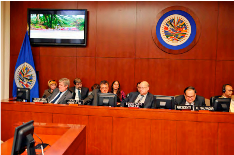
Reunión del Consejo Permanente para analizar la situación entre Costa Rica y Nicaragua. 10 de noviembre de 2010