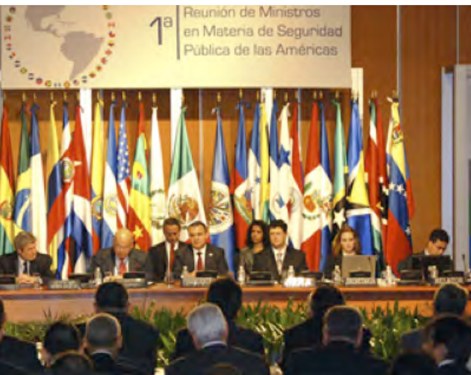
Primera Reunión de Ministros en Materia de Seguridad Pública de las Américas, México D.F., México, 7 y 8 de octubre de 2008