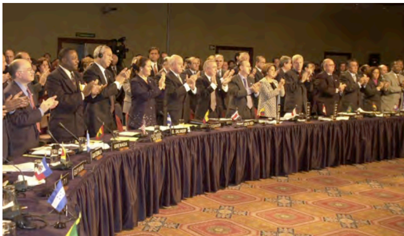
Los Cancilleres de las Américas aprueban la Carta Democrática Interamericana. Lima, Perú, 11 de septiembre de 2011

en sí misma se convierte en una condición fundamental para formar parte del sistema interamericano; caracteriza la democracia como un derecho; ofrece una definición mucho más amplia que la mera celebración de elecciones; considera a la democracia como un propósito que los Estados miembros se comprometen a promover; y finalmente compromete a los países a tener una acción colectiva para asegurar el restablecimiento del orden democrático cuando éste haya sido en cualquier forma alterado.