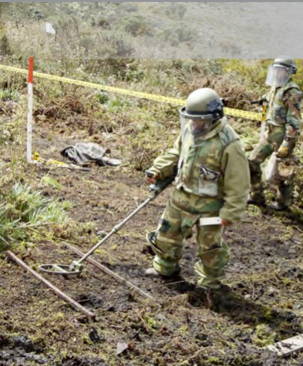
Una operación de desminado en Colombia