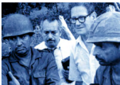
Observadores de la OEA consultan con los comandantes de las fuerzas opuestas durante la "Guerra del Fútbol" entre Honduras y El Salvador, 1969

Entre julio de 2003 y agosto de 2004, con el apoyo del Fondo de Paz, se culminó el proceso de demarcación de la frontera.