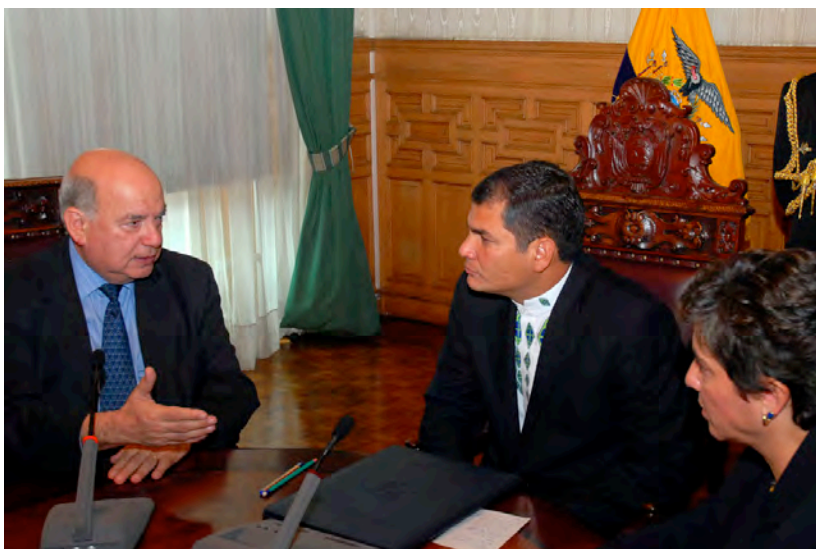
El Secretario General de la OEA se reúne con los Presidentes de Ecuador, Rafael Correa (arriba), y Colombia, Alvaro Uribe (abajo), para promover el acercamiento entre los dos países