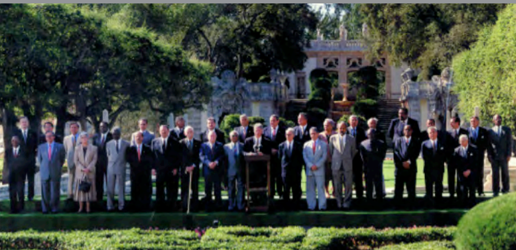
Primera Cumbre de las Américas. Miami, Estados Unidos, diciembre de 1994