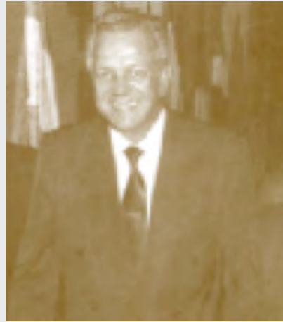
Juan Carlos Wasmosy, Presidente de Paraguay 1993-1998

El 22 de abril de 1996, el Presidente de la República y Comandante en Jefe de las Fuerzas Armadas de Paraguay, Juan Carlos Wasmosy, comunicó al General Lino Oviedo, Jefe del Ejército, su decisión de relevarlo de su cargo y pasarlo a retiro. La resistencia del General Oviedo para acatar el orden presidencial y su velado intento de golpe de estado a través de presiones e intimidaciones al legítimo mandatario, desencadenaron una seria crisis institucional en la joven democracia paraguaya.