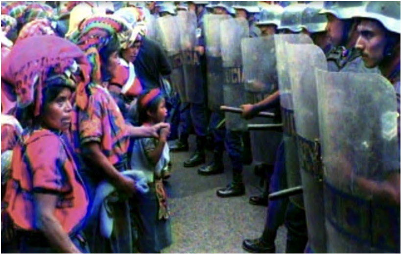
El Programa Especial de Apoyo a Guatemala de la OEA contribuyó a disminuir las graves tensiones sociales en el país