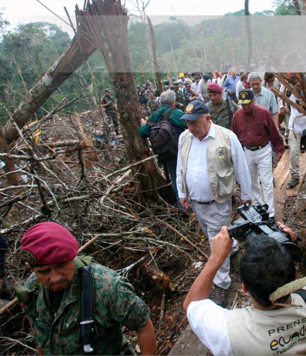
La Comisión encabezada por el Secretario General de la OEA, José Miguel Insulza, visita Angostura, en la frontera entre Ecuador y Colombia.