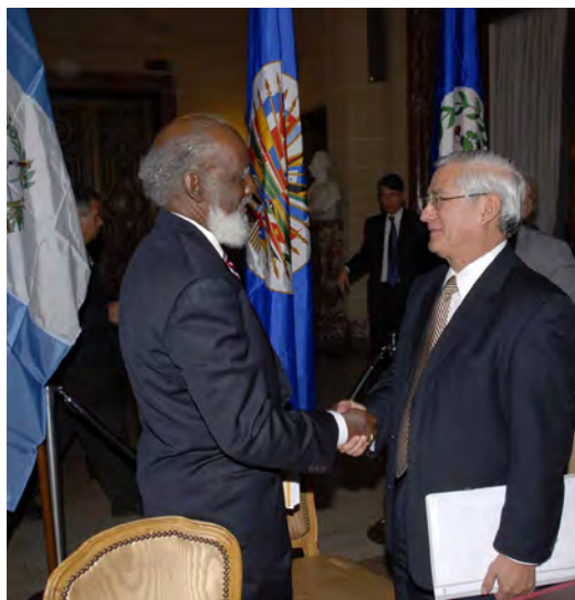
Los Cancilleres de Belize, Wilfred Elrington, y de Guatemala, Roger Haroldo Rodas Melgar, se dan la mano en la sede de la OEA luego de suscribir el Acuerdo Especial de 2008

El 7 de febrero de 2003 los Ministros de Relaciones Exteriores de ambos países junto con el Secretario General firmaron el Acuerdo para Establecer un Proceso de Transición y una serie de Medidas de Fomento de la Confianza entre Guatemala y Belize.