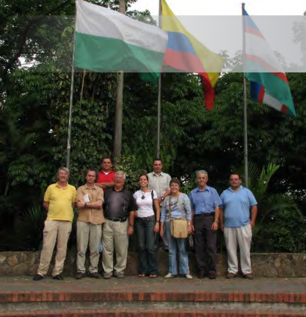
Miembros de la delegación que integró la Comisión Forense Internacional