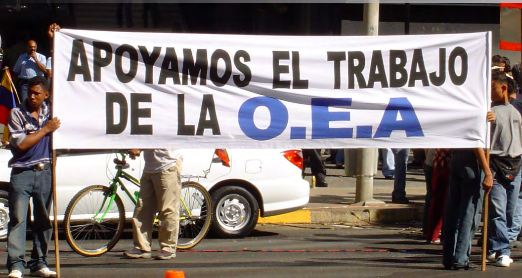
Ciudadanos venezolanos manifiestan apoyo a la Misión de la OEA durante la crisis del 2002