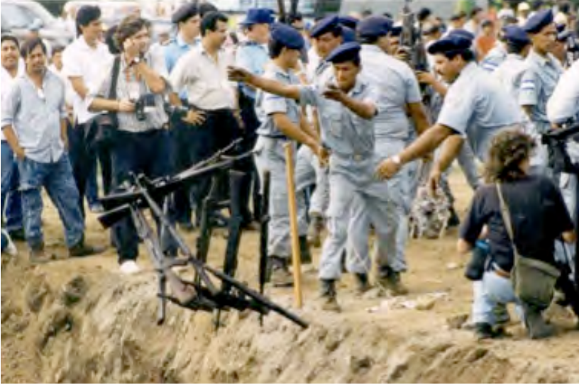
La OEA colaboró con las autoridades nicaragüenses en la destrucción de armas