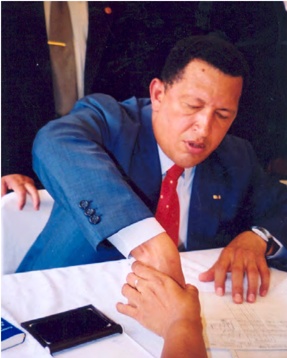
El Presidente de Venezuela, Hugo Chávez, participa en el Referéndum