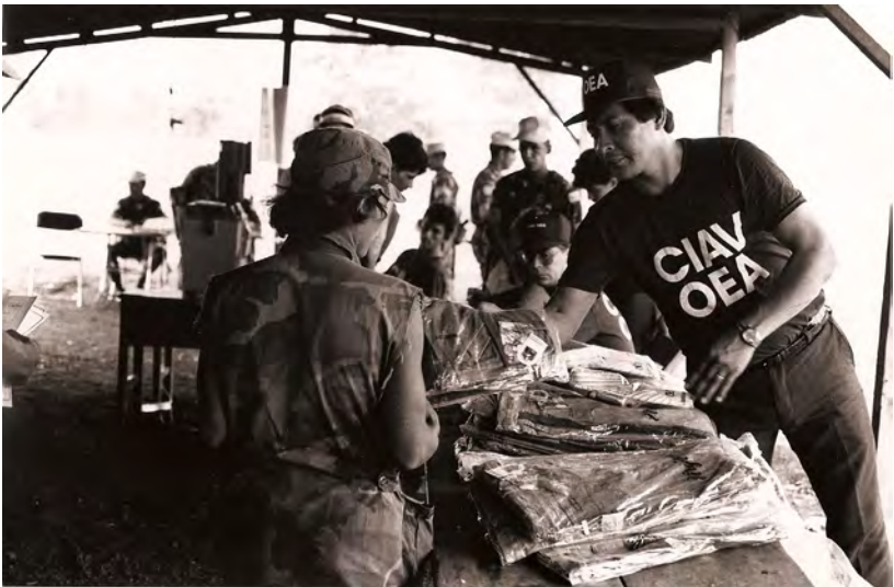
Un miembro de la CIAV/OEA distribuye ropa a ex-combatientes, en el marco del programa de asistencia humanitaria coordinado por la Misión