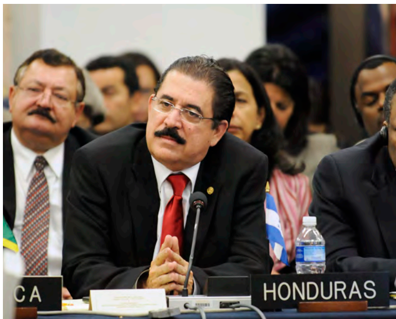
El ex Presidente de Honduras, José Manuel Zelaya Rosales

En la sesión extraordinaria de la Asamblea General, realizada el 1 de junio de 2011, se revocó la suspensión de Honduras, de acuerdo al Artículo 22 de la Carta Democrática Interamericana.