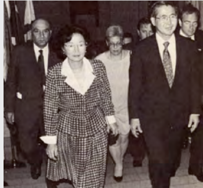
Alberto Fujimori, Presidente del Perú 1990-2000

La noche del 5 de abril de 1992 el Presidente Alberto Fujimori anunció al país la disolución del Congreso de la República, la reorganización del Poder Judicial, del Consejo Nacional de la Magistratura, del Tribunal de Garantías Constitucionales y del Ministerio Público, la reestructuración de la Contraloría General de la República y la creación de un Gobierno de Emergencia y Reconstrucción Nacional.