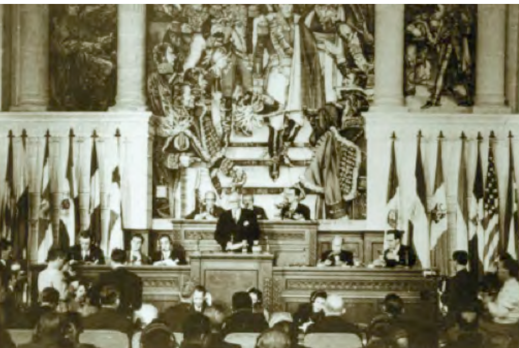
La Carta de la OEA se aprobó en la Novena Conferencia Internacional de Estados Americanos celebrada en Bogotá entre el 30 de marzo y el 2 de mayo de 1948