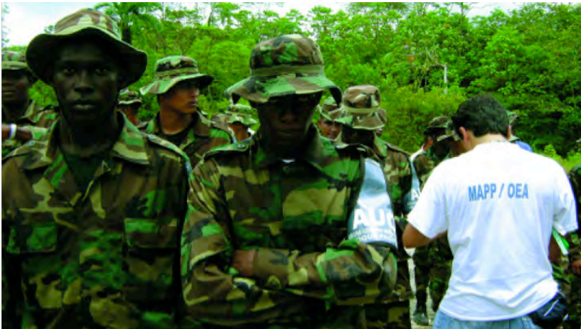
Oficial de la MAPP/OEA realizando labores de verificación del cese de hostilidades. Curumani, Cesar. Diciembre de 2005