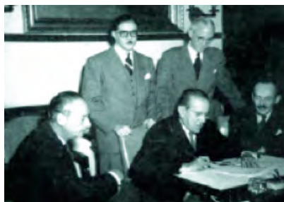
Embajador de Bolivia deposita la ratificación del Tratado de Río, 1950

Para el sistema interamericano, la seguridad hemisférica o seguridad colectiva hace referencia a lo expresado en la Carta de la OEA en su artículo 28, que se refiere específicamente a la inviolabilidad territorial. Esto demuestra cómo inicialmente la seguridad hemisférica se encontraba ligada directamente a una percepción de agresión externa que involucraba la defensa militar para prevenir cualquier amenaza proveniente del exterior. En este contexto histórico surgen el Tratado Interamericano de Asistencia Recíproca, también conocido como el TIAR o Tratado de Río, y el Tratado Americano de Soluciones Pacíficas o Pacto de Bogotá.