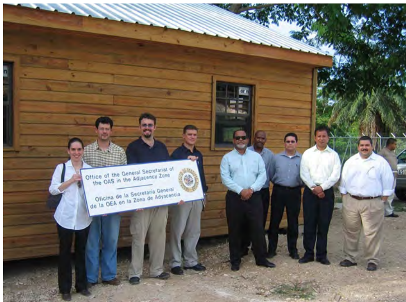
Oficina de la Secretaría General de la OEA en la Zona de Adyacencia entre Guatemala y Belize

El 8 de diciembre de 2008 los Cancilleres de Guatemala y Belize firmaron, en la Sede de la OEA y con el Secretario General como Testigo de Honor, el Acuerdo Especial entre Guatemala y Belize para Someter el Reclamo Territorial, Insular y Marítimo de Guatemala a la Corte Internacional de Justicia (CIJ) mediante el cual, ambos países se comprometieron a someter a una consulta popular la decisión de llevar a la CIJ la resolución de la controversia territorial.