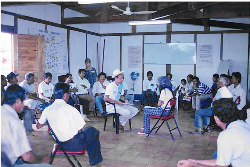
La OEA llevó a cabo diversos procesos de formación y capacitación de operadores clave del Gobierno y de la sociedad civil guatemalteca en materia de resolución pacífica de conflictos