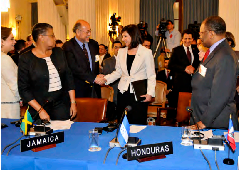
La Vicepresidenta de Honduras, María Antonienta de Bográn, se une a la 41ª Sesión Extraordinaria de la Asamblea General de la OEA, tras el levantamiento de la suspensión del derecho de participación de su país en la Organización. Washington D.C., Estados Unidos, 1 de junio de 2011