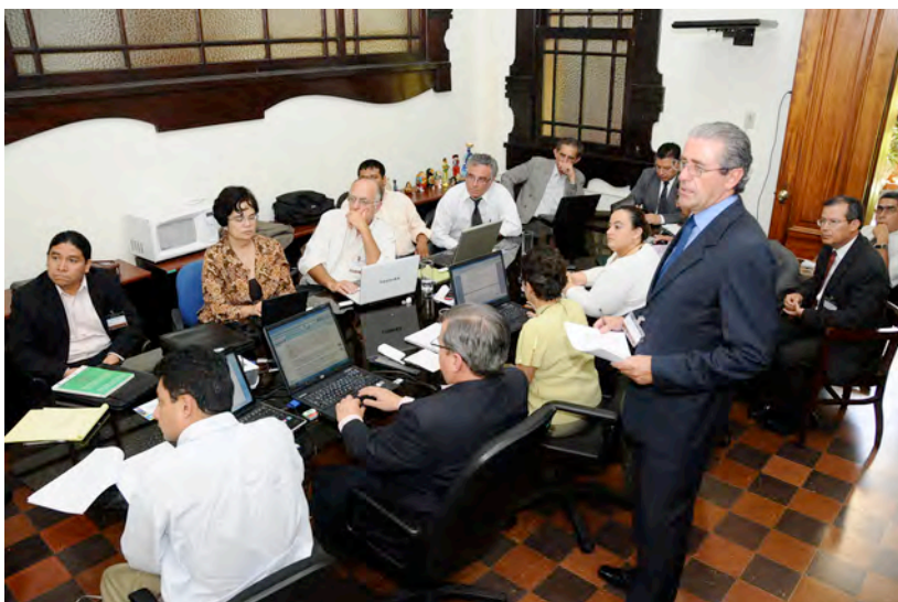
Sesión de la Mesa Política de Diálogo y Negociación