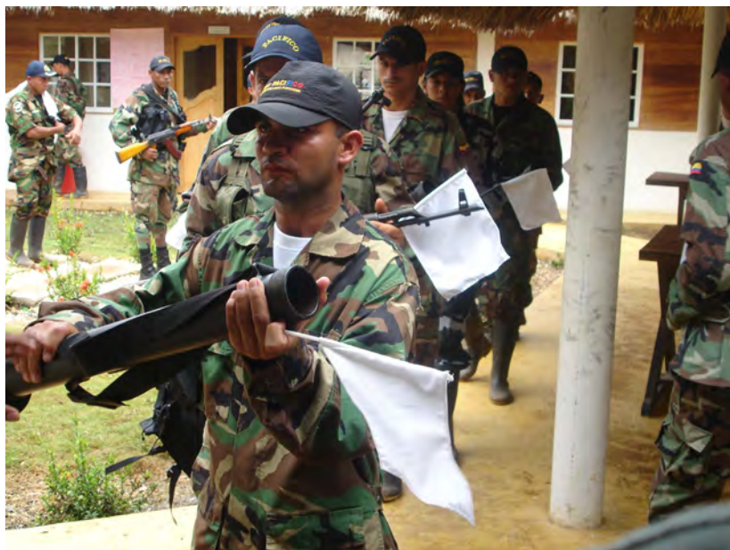
Entrega de armas por parte de los integrantes de los Anillos de Seguridad de las AUC en el curso de su desmovilización. Santa Fe de Ralito, Córdoba. Agosto de 2005

verificación de la entrega, la custodia y la destrucción de las armas entregadas por los grupos ilegales armados; y el apoyo a iniciativas locales en zonas de conflicto, a través de medidas y acciones encaminadas a reducir la violencia, cimentar la confianza, obtener la reconciliación y fortalecer la democracia.