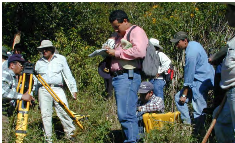
Técnicos de la OEA y del Instituto Panamericano de Geografía e Historia ayudan a demarcar la frontera internacional entre Honduras y el Salvador

En septiembre de 2002, los Presidentes de Honduras y El Salvador se comprometieron a finalizar la demarcación de la frontera terrestre entre ambos países en un plazo de 18 meses.