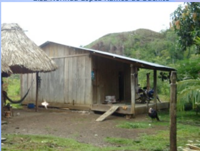
Vivienda anterior de Rigoberto Gutiérrez