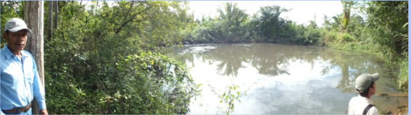
Vista de uno de los pozos de agua que están en la finca