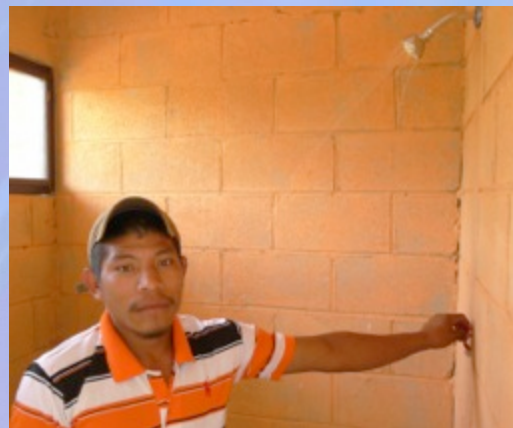
Viviendas con servicio de agua funcionando