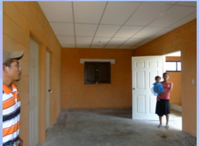
Interior de vivienda