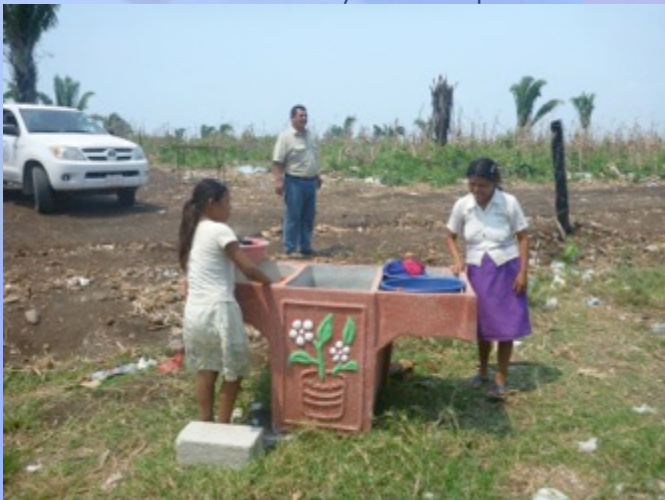
Entrega de pilas para lavado a beneficiarios