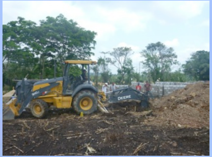
Movimiento de tierra