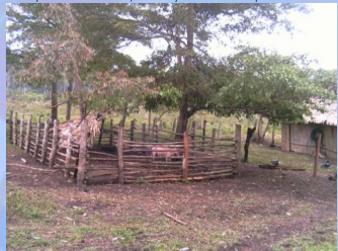
Vista Lateral de vivienda de Rigoberto Gutierrez