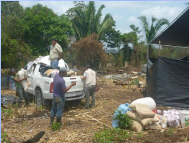
Implementación de alimento por trabajo, con la presencia de la procuraduría de los Derechos Humanos de Guatemala.