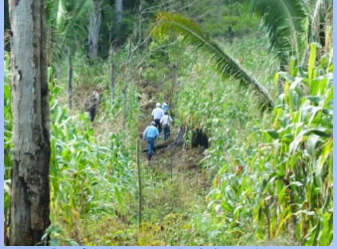
Beneficiarios reconociendo los mojones