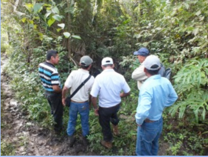
Beneficiarios y personal de la OEA recorriendo la propiedad