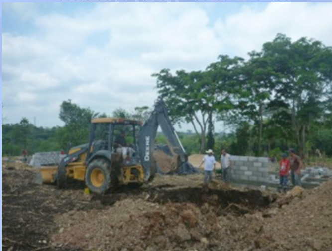
Excavación para Proyecto de Aguas Negras