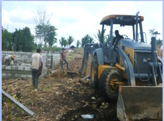
Inicio de las obras