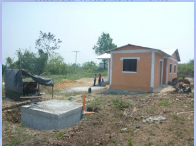
Proyecto de Aguas Negras terminado