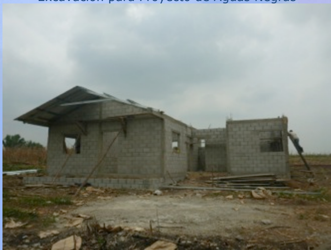
Proceso de construcción de la vivienda