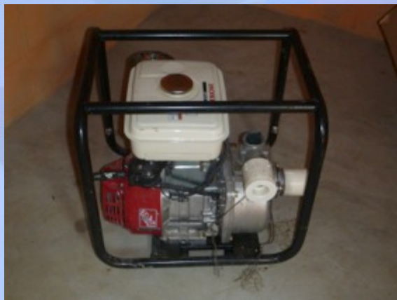
Bomba de agua de 4 caballos de fuerza