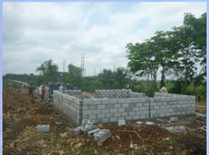
Proceso de construcción de las viviendas