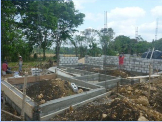
Proceso de construcción de las viviendas