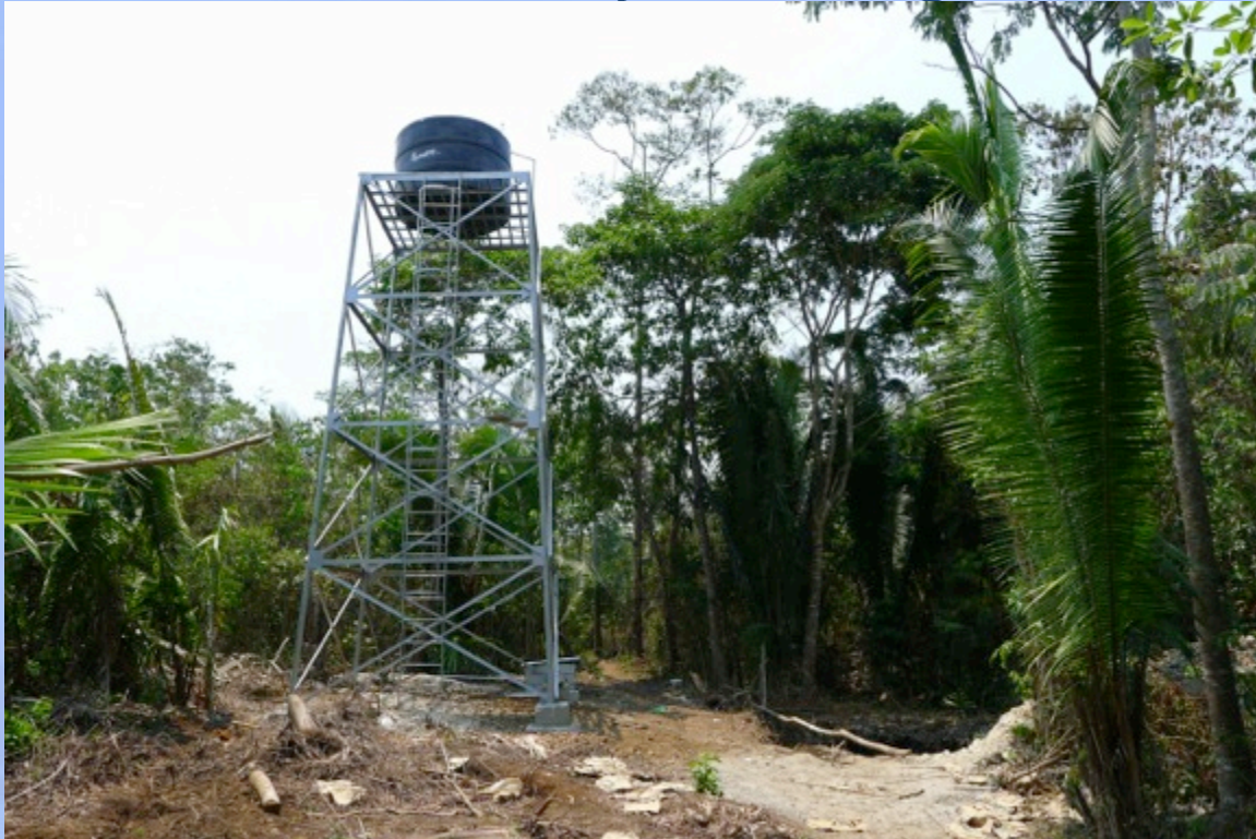
Se instaló un tanque reservorio de 5,000 litros en una torre metálica