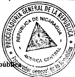
Hernán Estrada Procurador General de la República