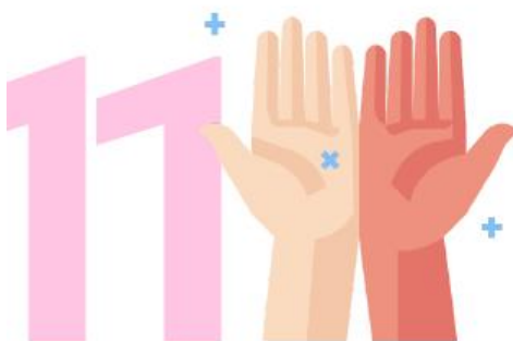
Una vez secas, sus manos son seguras.