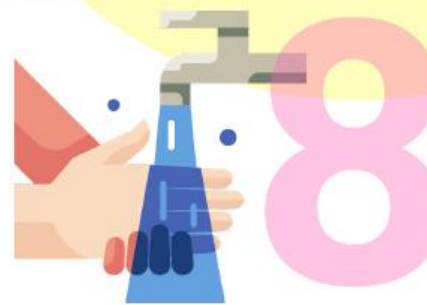
Enjuáguese las manos con agua.