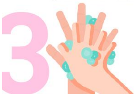
3 Frótese la palma de la mano derecha contra el dorso de la mano izquierda entrelazando los dedos y viceversa.