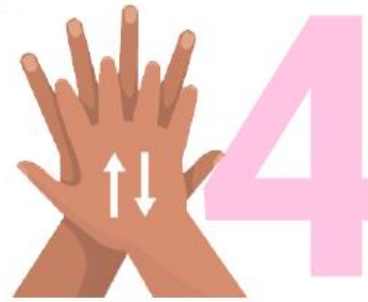
4 Frótese las palmas de las manos entre sí con los dedos entrelazados.