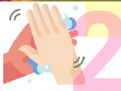
2 Frótese las palmas de las manos entre sí.