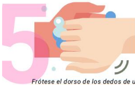
5 Frótese el dorso de los dedos de una mano con la palma de la mano opuesta agarrándose los dedos.