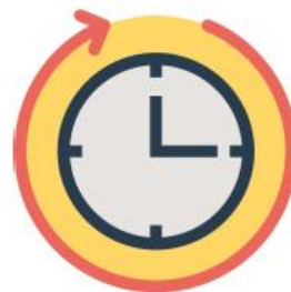
Realice este procedimiento de 40 a 60 segundos