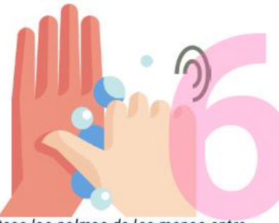
6 Frótese las palmas de las manos entre sí.