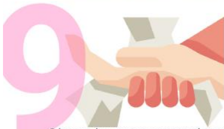
Séquese las manos con papel para el secado de manos.