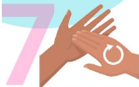
Frótese la palma de la mano derecha contra el dorso de la mano izquierda entrelazando los dedos y viceversa.