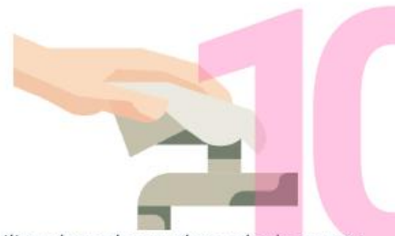
Utilice el papel para el secado de manos, para cerrar el grifo.