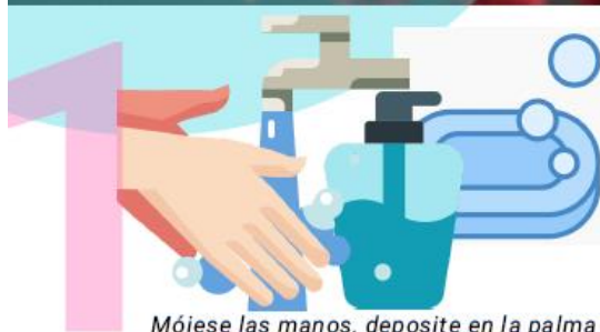
1 Mójese las manos, deposite en la palma de la mano una dosis de jabón, suficiente para cubrir todas las superficies.