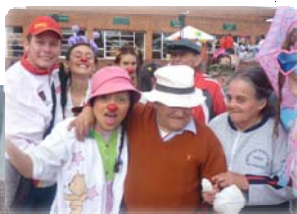
Celebración día del Adulto Mayor

Fundación Hogar San Francisco de Asís. Colombia