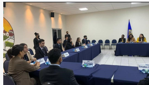
Delegaciones reunidas en la Comisión General

Con respecto a las expectativas de la primera sesión de la MOEA, dijo: “siempre una experiencia gratificante escuchar a otras personas que saben mucho sobre estos temas y participar, creo que fue un buen inicio, esperamos que siga mejor”, con esas palabras finalizó sus puntos de vista al evento