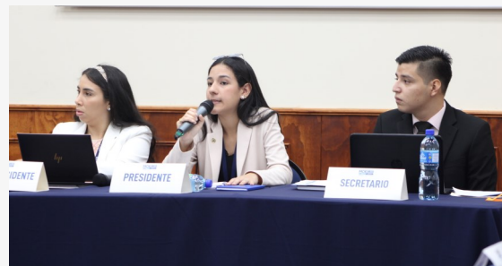
Inicia el debate en la comisión.

Comenzó el debate con 16 países presentes. Los equipos estaban conformados por los delegados de Argentina, Santa Lucía y Trinidad y Tobago, fueron estos los que tomaron la moción de la paz, Uso apropiado de las TICs. Mientras, su contraparte (Honduras, Brasil, Saint Kits and Nevis, tomaron la preposición de los derechos humanos.