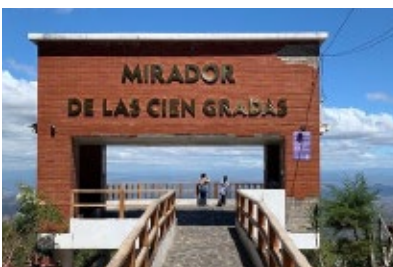
MIRADOR DE LAS CIEN GRADAS, USULUTLÁN