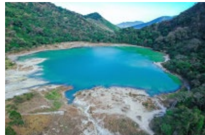
LAGUNA DE ALEGRÍA, USULUTÁN