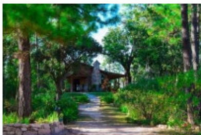
VILLA VERDE, PERQUÍN, MORAZÁN