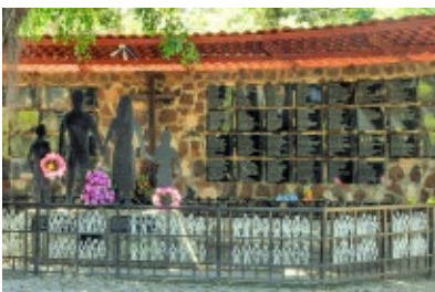
MONUMENTO A LAS VÍCTIMAS DE LA MASACRE DEL MOZOTE, MORAZÁN