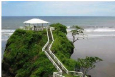
PLAYA LAS FLORES