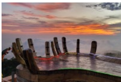
PARADISE SAN LORENZO, USULUTÁN