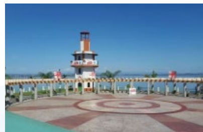
PARQUE DE LA FAMILIA, LA UNIÓN