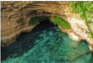
CUEVAS DE MONCAGUA, SAN MIGUEL