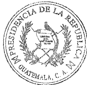
Gendri Rocael Reyes Mazariegos Ministro de Gobernación