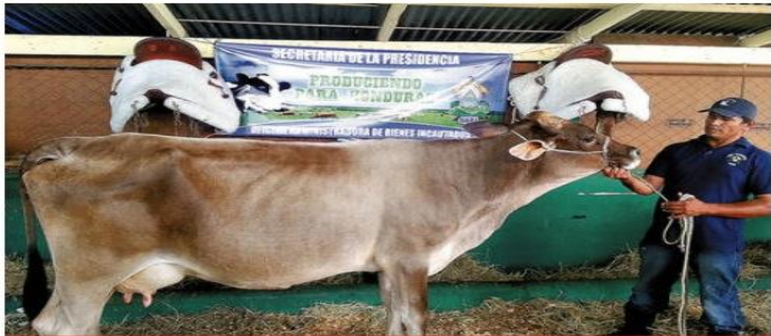
Este es uno de los semovientes manejados por la OABI que participa en la