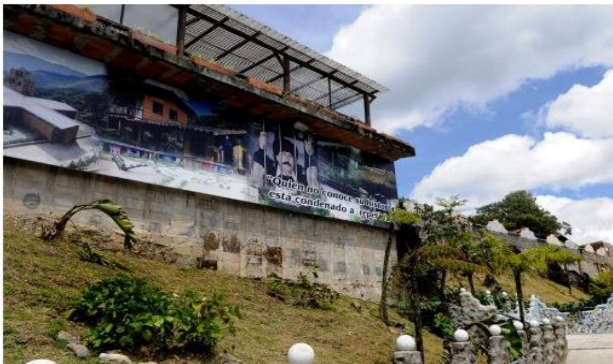
La lujosa cárcel que se levantó para el narcotraficante colombiano Pablo Escobar cuando se entregó a las autoridades en 1991.

La Catedral, la lujosa cárcel que se levantó para el narcotraficante colombiano Pablo Escobar cuando se entregó a las autoridades en 1991 y de la que después se fugó, se convertirá 20 años después en un hogar para ancianos sin recursos.