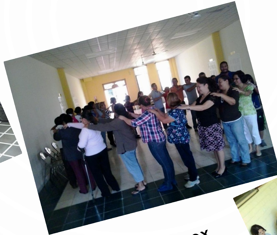
Trabajos ex aula, grupales y de investigación