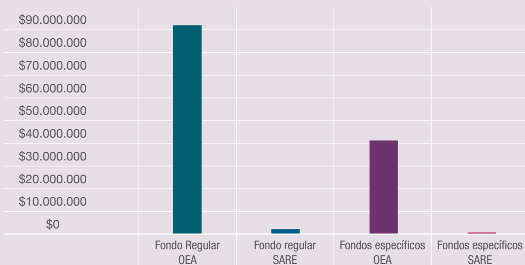
Recursos Financieros de la SARE por fuente de financiamiento