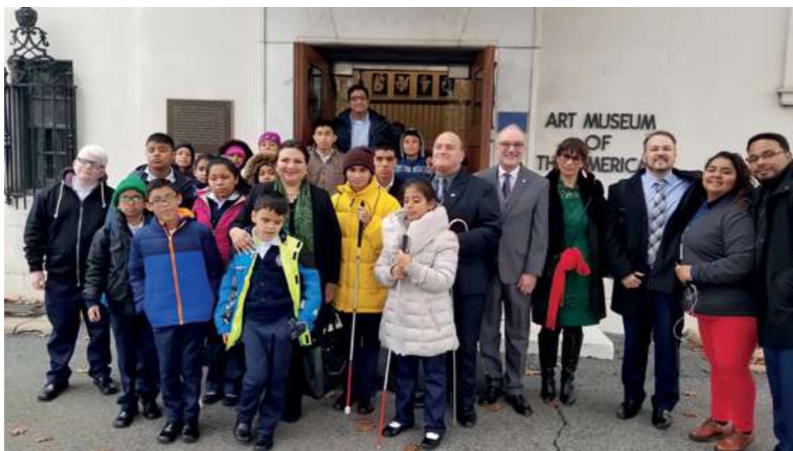
Presentación del Coro de Niños Voces de Luz y Expresión del Silencio del Benemérito Comité Pro Ciegos y Sordomudos de Guatemala

Asimismo, el Departamento de Inclusión Social participa en el acompañamiento e implementación del Programa de Acción para el Decenio de las Américas por los Derechos y la Dignidad de las Personas con Discapacidad. Con la adopción de este programa, los Estados Miembros de la OEA se comprometieron a adoptar gradualmente, y dentro de un tiempo razonable, las medidas administrativas, legislativas, judiciales, así como las políticas públicas necesarias para que las personas con discapacidad estén en igualdad de condiciones frente a los demás. El Departamento de Inclusión Social ejerce igualmente de Secretaría Técnica a cargo de coordinar las actividades inherentes al Programa.