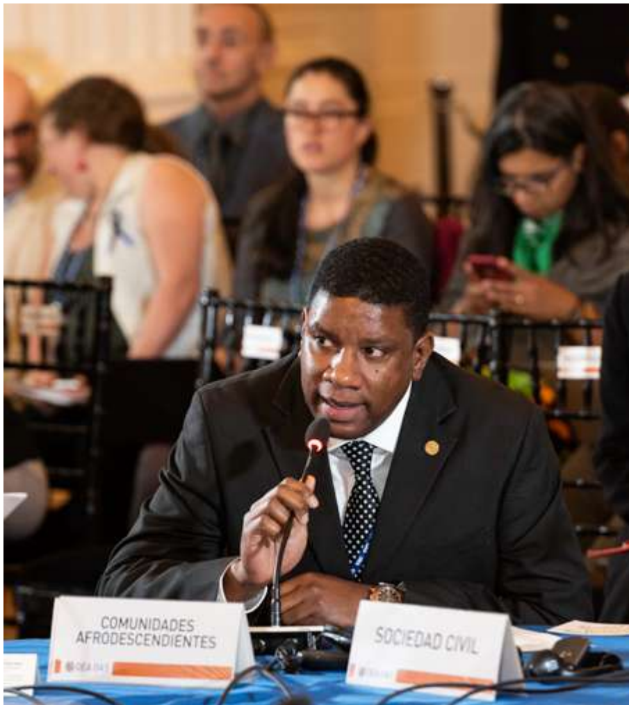
Participación de la sociedad civil en la 48ª Asamblea General de la OEA