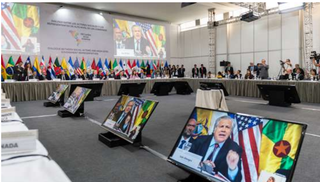
Participación de la sociedad civil en la VIII Cumbre de las Américas