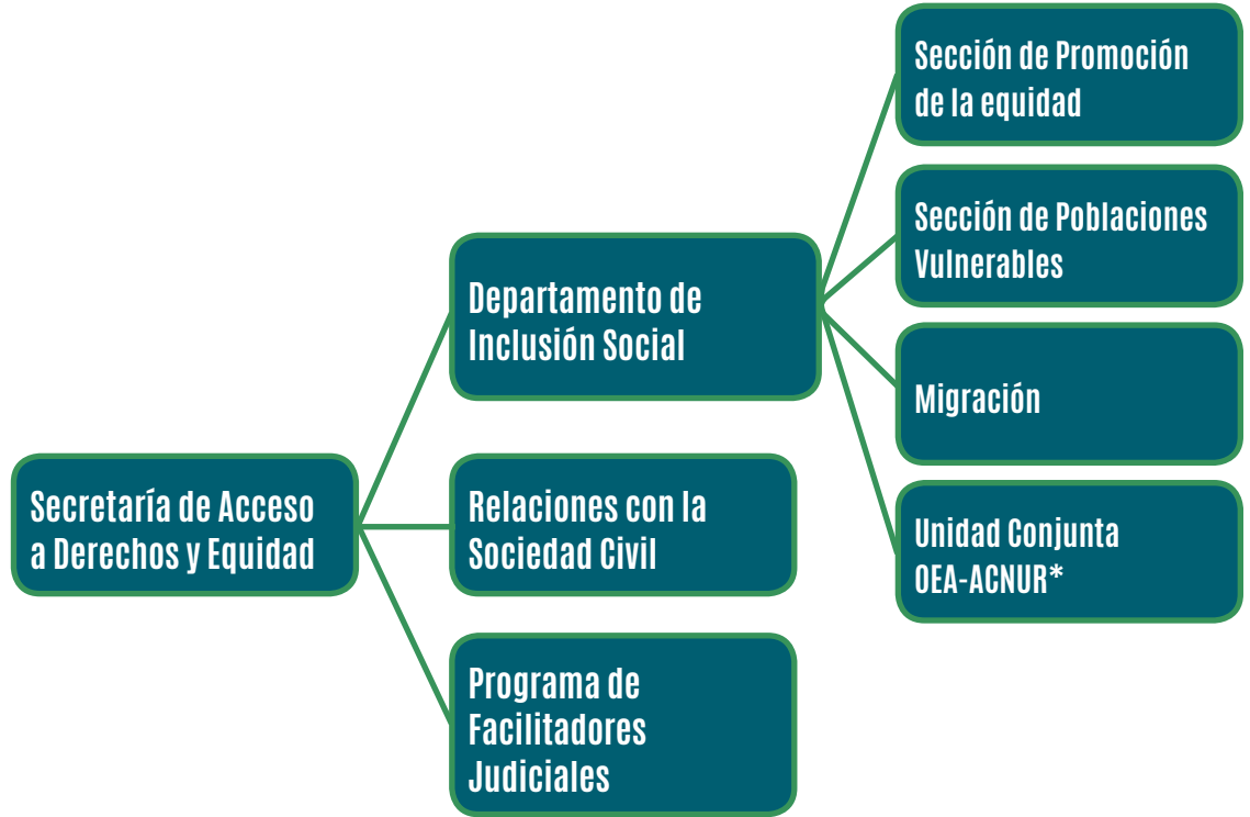
Figura 2. Estructura Organizacional de la SARE: