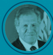
Luis Almagro Secretario General