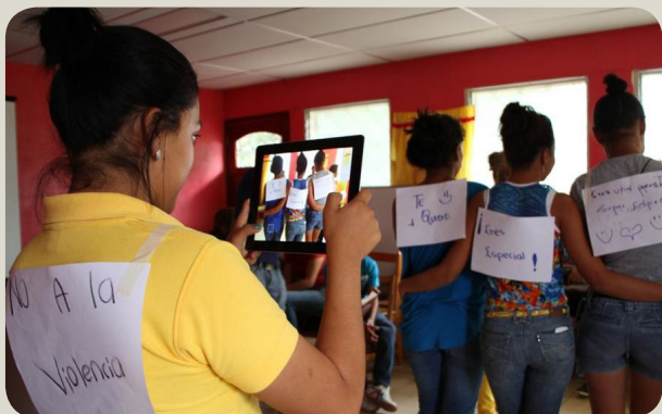
Nicaragua gana Mención especial en Enfoque de género en los excelGOB2014