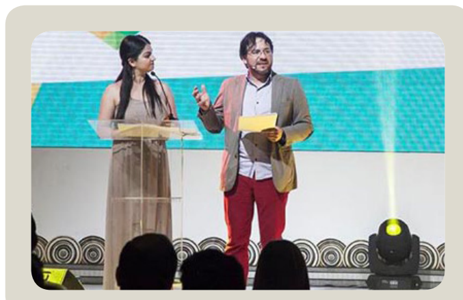
Ceremonia de los excelGOB2014 en Colombia

URL: https://www.gob.mx/innovamx y https://www.gob.mx/participa/consultas/redblockchainmexico