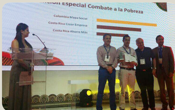
Mención especial excelGOB2014 a lucha contra la pobreza.

Entidad: Coordinación de la Estrategia Digital Nacional de la Oficina de la Presidencia. URL: www.ia2030.mx