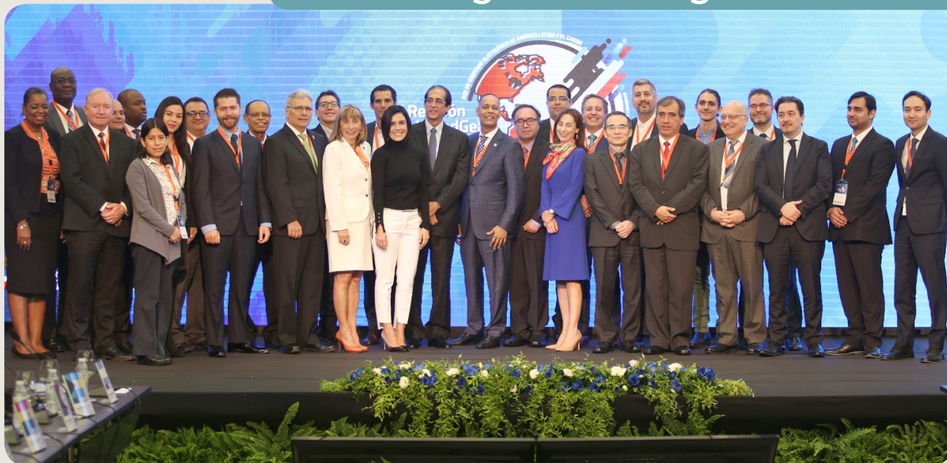
Foto oficial de la XI Reunión anual de Red Gealc (Santo Domingo, 2017)