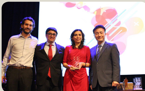
Simple (Chile) gana excelGOB2016 en software público

Entidad: Agencia de Gobierno Electrónico y Sociedad de la Información (AGESIC). URL: https://www.agesic.gub.uy/innovaportal/v/7204/1/agesic/primer-edicion-de-las-jornadas-tecnologicas:-blockchain-mas-alla-de-su-auge.html