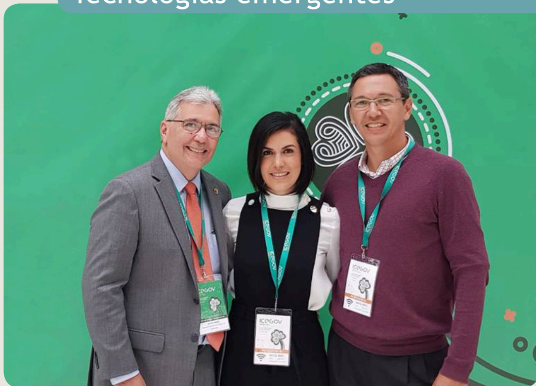
Tres países participantes del grupo tecnologías emergentes 2018: Panamá, México y Uruguay.