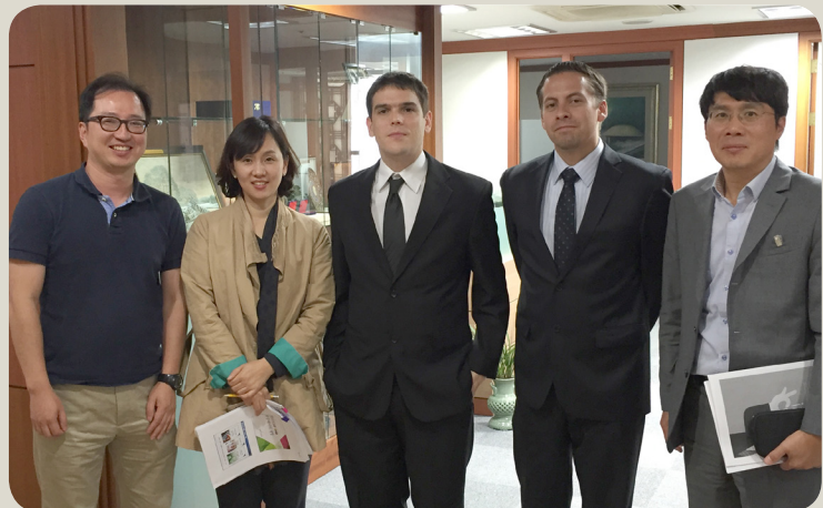
Misión a Corea de los ganadores de los excelGOB2014

URL: https://play.google.com/store/apps/details?id=sv.gob.lnb.mobile&hl=es