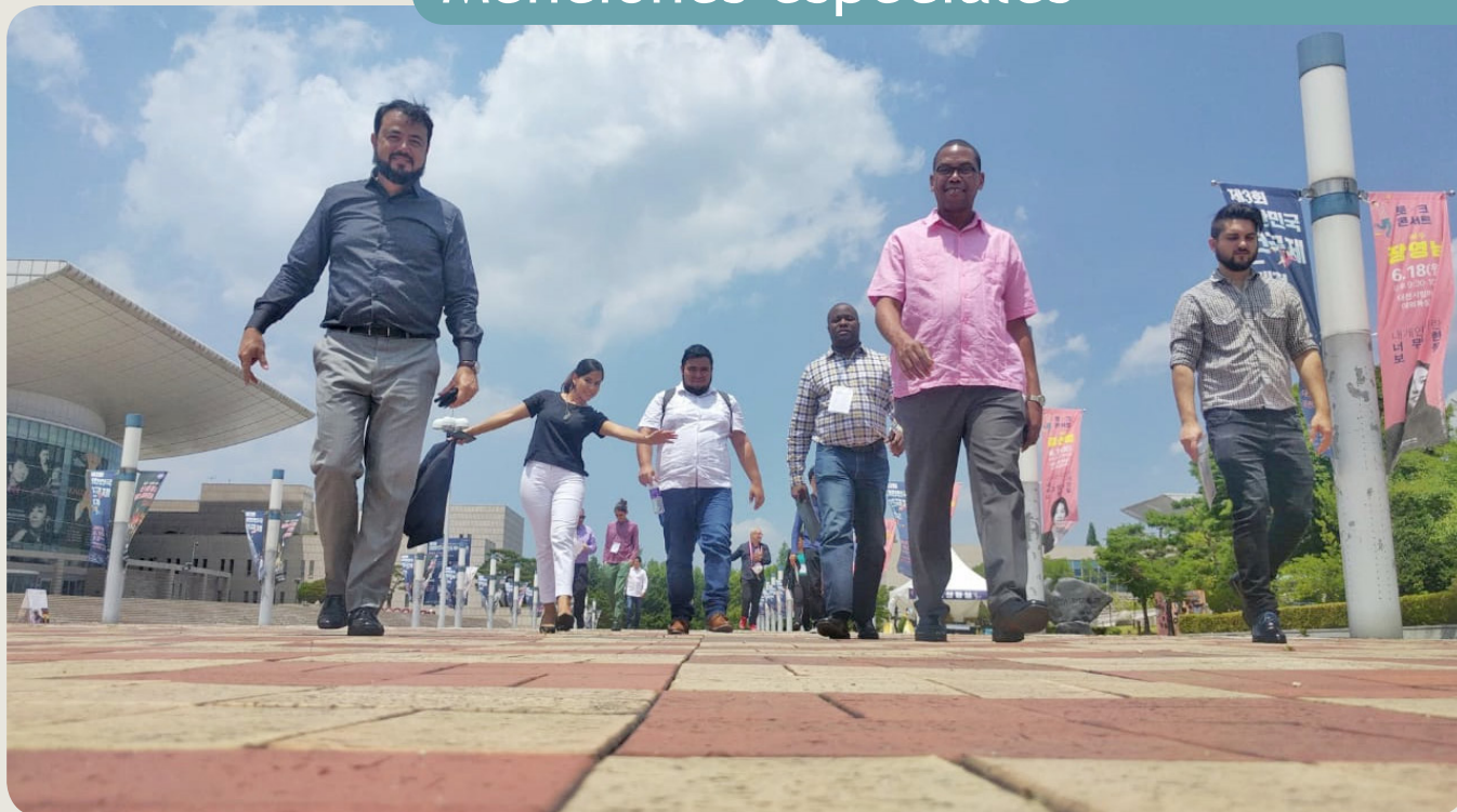
Misión a Corea 2018.