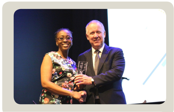
Trinidad y Tobago recibe Premio excelGOB2016