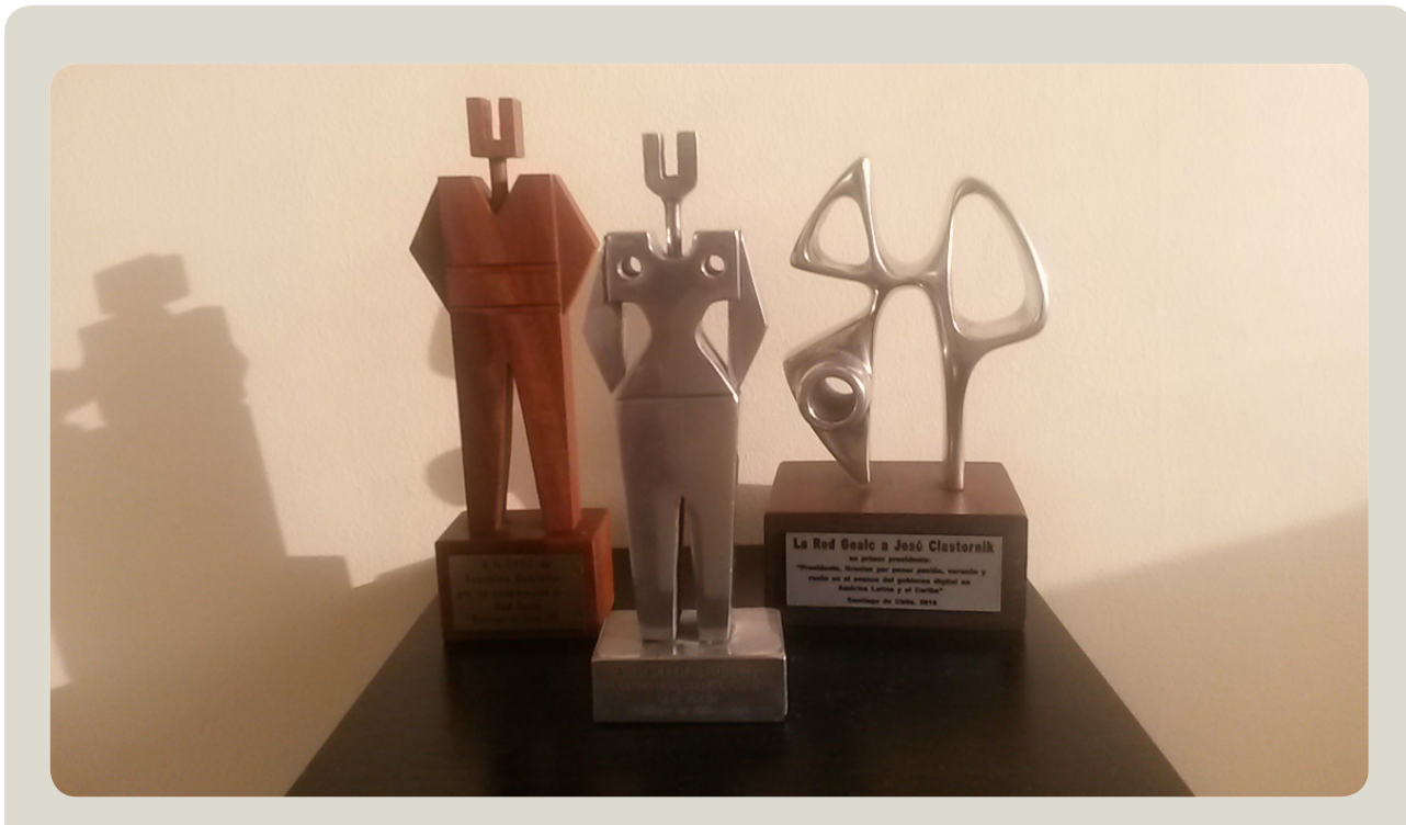
Estatuillas de la edición 2016 de los premios excelGOB.

Los premios a la excelencia en gobierno electrónico, excelGOB, son convocados por la Red de Gobierno electrónico de América Latina y el Caribe (Red GEALC), con el apoyo de la Organización de los Estados Americanos (OEA) y el Banco Interamericano de Desarrollo (BID). Reconocen las mejores soluciones implementadas por los gobiernos de la región para una gestión pública centrada en las y los ciudadanos. En cada edición permiten conocer y sistematizar lo más innovador que se realiza en la región en gobierno digital.