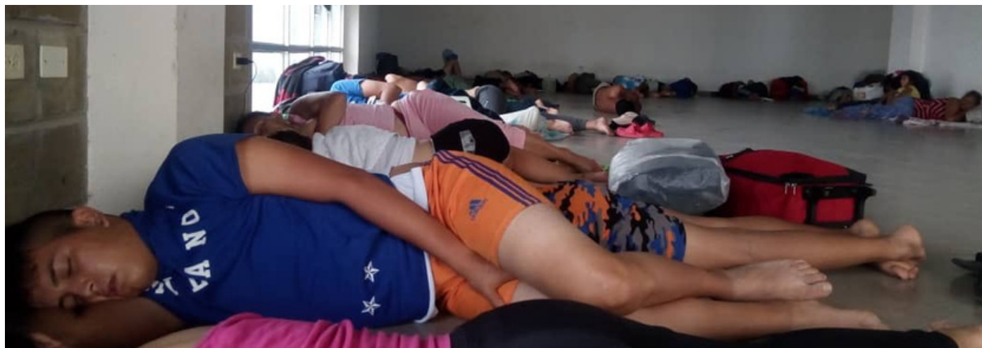
Un grupo de migrantes venezolanos retornados duermen aglomerados en el piso de un centro de cuarentena en Venezuela (Abril 2020)