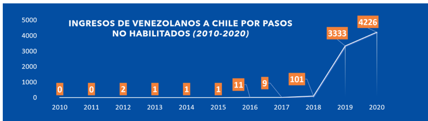
Servicio Jesuita a Migrantes, SJM (2020)