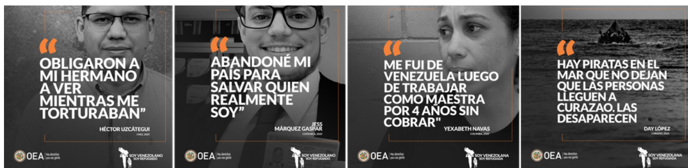
Campaña regional "Soy Venezolano, Soy Refugiado" (Junio 2020)